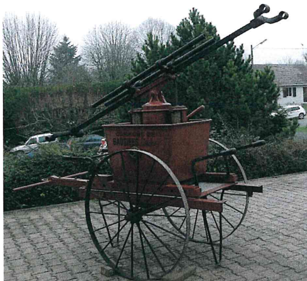
La Pompe à Bras.

Le Corps Communal des Sapeurs-Pompiers a été créé en 1927. Au début, le corps était équipé d'une pompe à bras qui a été remplacée en 1962 par un fourgon pompe tonne sur châssis Chevrolet, d'une contenance de 1800 L, remplacé ensuite en 1976 par un Camion-Citerne Feu de Forêt de 4000 L (CCF 4000), sur châssis GMC, en service jusqu'en mars 2008.