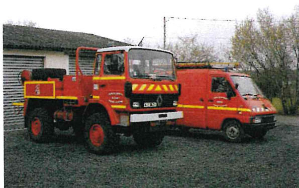
Le CCF 2000 et le VTU.

En 2008 : La commune achète un CCF 2000 Renault, en remplacement du GMC, en vue de la départementalisation du CPII, le 1 er Janvier 2009.