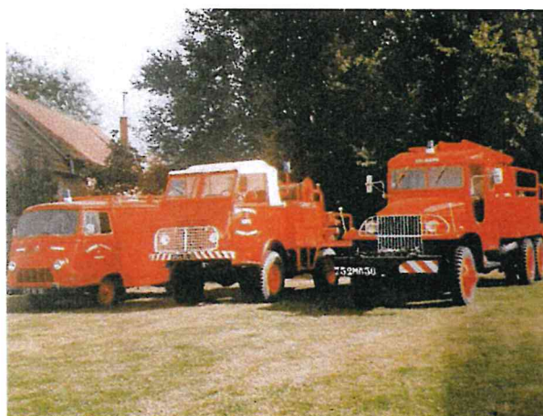
L'estafette Renault, le CCFL Renault et le GMC.

En 1990 : L'amicale se dote d'un châssis Renault, transformé en CCFL (Camion-Citerne Feu de Forêt Léger), par l'employé communal de l'époque, qui sera réformé et non remplacé en 2009.